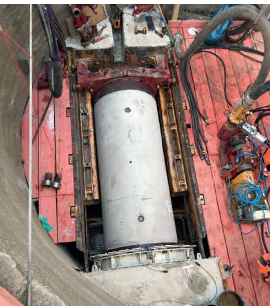
Проект Datteln: соединение с помощью коннектора уже выполнено до начала продавливания следующей трубы