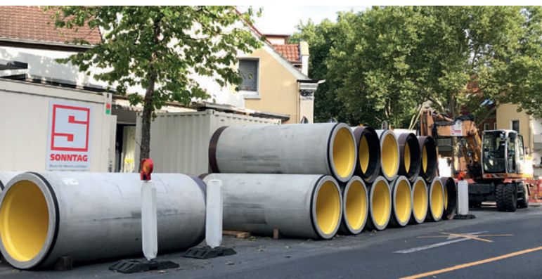
Проект Dattel, Северный Рейн-Вестфалия, Германия: открытый склад труб для микротоннелирования Perfect Pipe DN1200 компании Beton Müller

В том случае, когда в проекте трубопровода требуется защита от химического воздействия, возникают вопросы о ее реализации и долговечности при длительной эксплуатации. Это начинается с выбора материала, охваты-