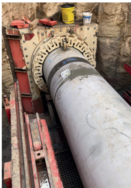
Проект DN700, Медернах, Люксембург: стартовый котлован

ваит условия укладки и, в конечном счете, предъявляет особые требования к производителю труб. Материал футеровки - полиэтилен, перерабатываемый на заводе Beton Müller в промышленных масштабах, и именно он лежит в основе герметичности футеровки труб. Процессы сварки и формовки находятся под постоянным контролем с помощью внутреннего и внешнего мониторинга и обеспечивают антикоррозионную защиту трубы от гладкого конца до раструба. Коннекторы идеально дополняют гибридную трубу. Они устанавливаются в трубу до помещения следующей трубы в стартовый котлован. Как во время продавливания, так и позже – например, в случае изменения положения трубы в грунте – коннекторы обеспечивают гибкое и одновременно герметичное соединение муфты.