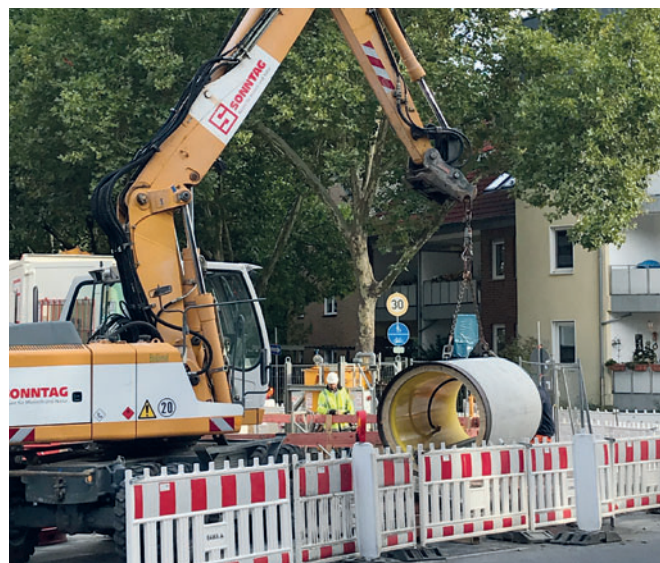
Проект Dattel: спуск в стартовый котлован, система для подачи бентонитовой смазки