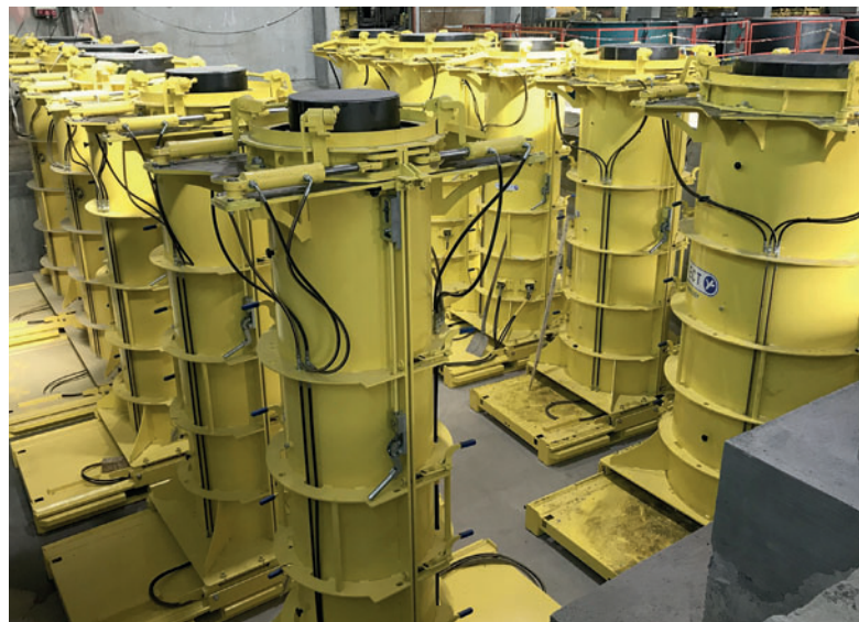
Производство труб для микротоннелирования на предприятии Beton Müller с помощью форм Perfect компании Schlüsselbauer Technology

Если в Северной Америке и Азии трубы Perfect Pipe уже несколько лет используются как для микротоннелирования, так и для открытой траншейной укладки (статья в выпуске №2 журнала «Международное бетонное производство»